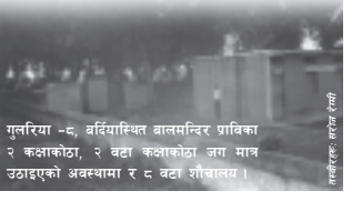
गुलरिया -६, बर्दियास्थित बालमन्दिर प्राविका २ कक्षाकोठा, २ वटा कक्षाकोठा जग मात्र उठाइएको अवस्थामा र २ वटा शौचालय।

जिल्लामा उपलब्ध सेवा सुविधाले घेरिएको सदरमुकामकै विद्यालयको भौतिक पूर्वाधार दयनीय छ, विद्यार्थीहरू रूखमुनि बसेर पढ्नुपर्छ भन्दा विश्वास गर्न गाह्रो पर्छ। तर, बर्दिया जिल्लाको सदरमुकाम गुलरियाकै प्राथमिक विद्यालयहरूले वर्षौंदेखि यस्तै निर्यात भोइदै आएका छन्। कहिँ कतैबाट सहयोग नपाएर विद्यालयहरूको हालत यस्तो भएको चाहिँ होइन। विद्यालयको आवश्यकता अनुरूपको क्षेत्रमा भन्दा पनि आफ्नो स्वार्थको क्षेत्रमा सहयोग गर्ने संस्थाहरूको व्यवहारका कारण विद्यालयहरूले सहयोग पाइरहेदा पनि उनीहरूको स्थिति उस्तै रहन गएको हो। यी विद्यालयहरूमा कक्षाकोठाभन्दा शौचालयहरू धेरै छन्। त्यस्तै शौचालयहरू पढ्की छन्, कक्षाकोठा भने छाप्राएले बनेका छन् यसको एउटा उदाहरण हो- बालमन्दिर प्राविक।