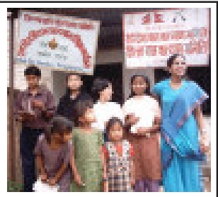
तानसेनस्थित बालकल्याण समितिले सञ्चालन गरेको पूर्णदिवसीय असहाय बाल शिक्षा कार्यक्रमका विद्यार्थी र शिक्षिका।

प्राथमिक तहको शिक्षा प्रदान गर्न यो कक्षा सुरु गरिएको हो। यहाँ पढ्ने बालबालिकालाई सरकारी विद्यालयलमा लगी परीक्षा दिने व्यवस्था मिलाइन्छ। यहाँ ९० जना भन्दा भएपनि नियमित कक्षा लिन २१ जना मात्र आउने गरेका छन्।