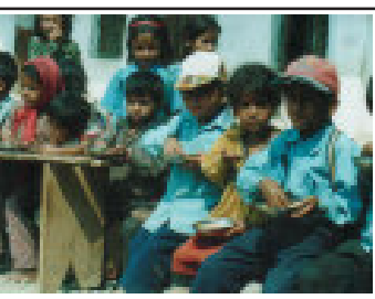
तेल र खाजा कार्यक्रमका कारण विद्यार्थीहरूमा उत्साह देखिन्छ।

नुवाकोट जिल्लामा पौष्टिक आहार र खाने तेल वितरण गर्ने कार्यक्रम लागू भएपछि यहाँका अभिभावकले छोरीलाई विद्यालय पठाउनमा जोड दिन थालेका हुन्। छोरीलाई स्कूल पठाएपछि महिनामा दुई लिटर तेल विद्यार्थीका अभिभावकले